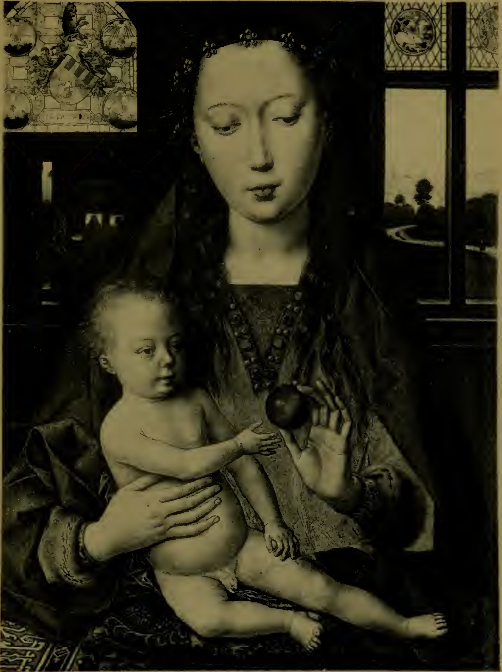
La Vierge à la pomme, diptyque.